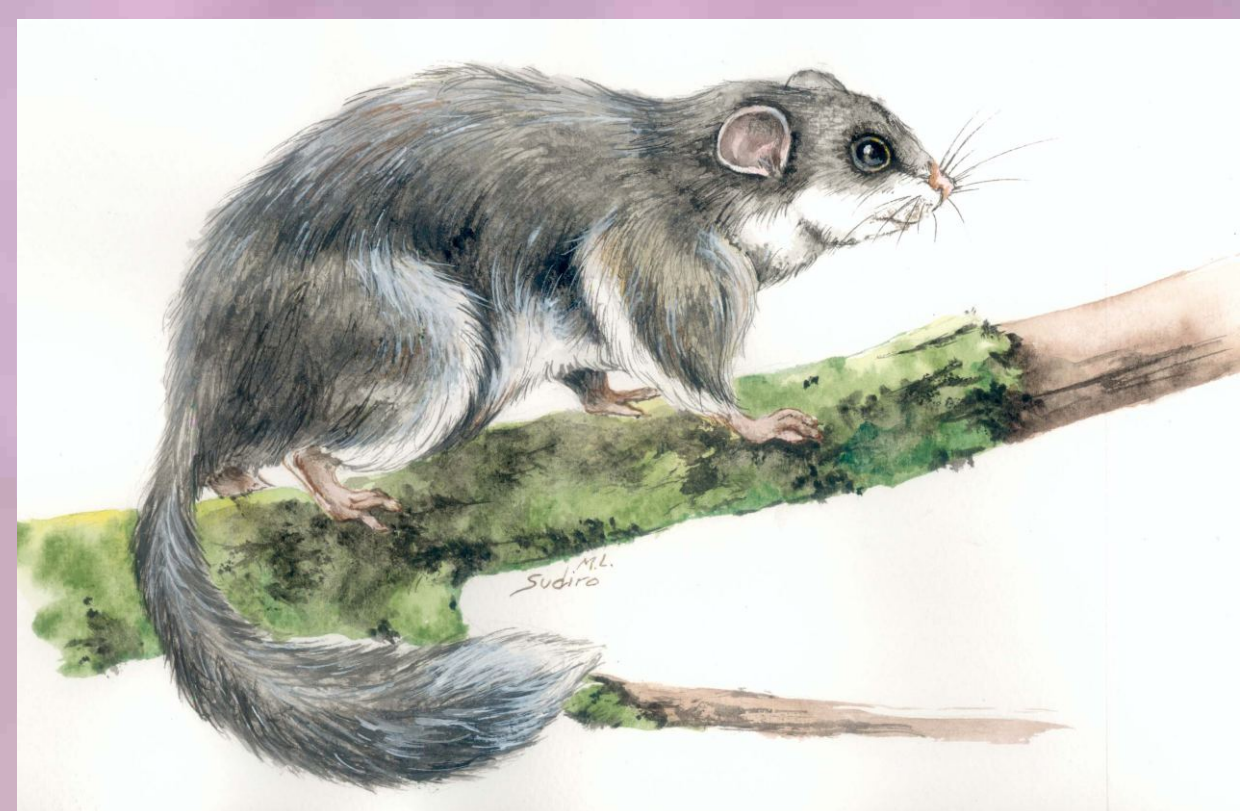
Leithia melitensis (Adams, 1863)

Leithia melitensis è un gliride di grande taglia, endemico della Sicilia e di Malta e componente tipico della fauna del "Complesso ad Elephas falconeri " (parte inferiore del Pleistocene medio). Il Museo di Geologia e Paleontologia dell'Università di Padova possiede uno scheletro montato composto di L. melitensis , numero di catalogo MGPD 27891, che fu acquistato con ogni probabilità nel 1936, come risulta dai registri inventariali di quell'anno. La località di provenienza è la Grotta Marasà (Palermo). Osservando lo scheletro è evidente che l'animale era grande circa il doppio del comune ghio ( Glis glis ).