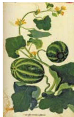
11 lo sono ANGURIA