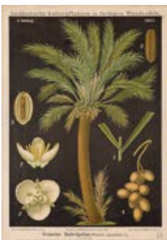
9 lo sono DATTERO