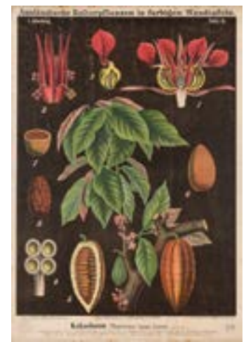
4 lo sono CACAO