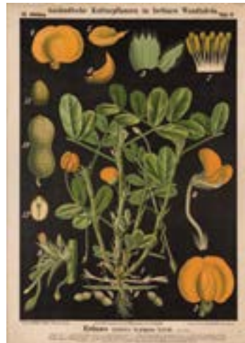
6 lo sono ARACHIDI