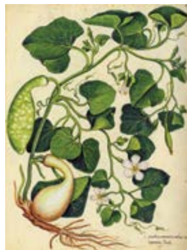
3 lo sono ZUCCA