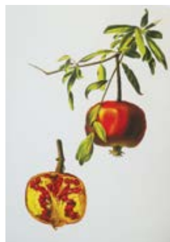
10 lo sono MELOGRANO