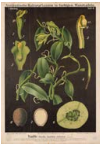
1 lo sono VANIGLIA