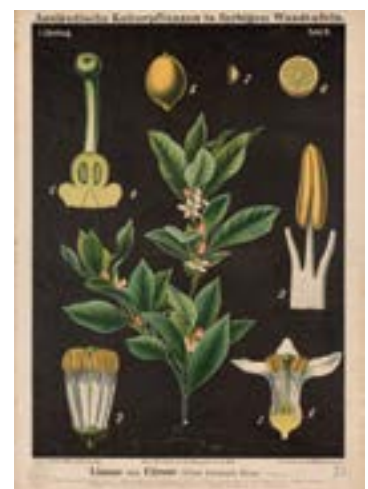
12 lo sono LIMONE