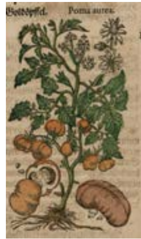
7 lo sono POMODORO