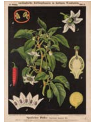
8 lo sono PEPERONCINO