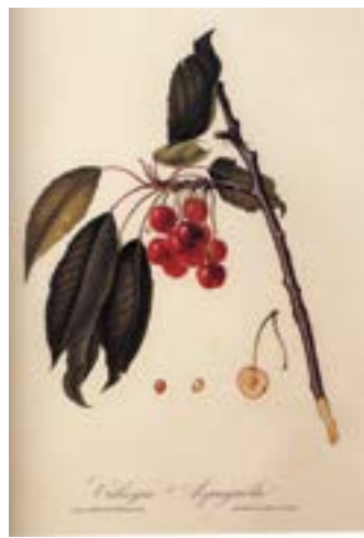
2 lo sono CILIEGIO