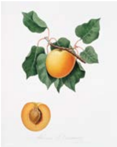
5 lo sono ALBICOCCO