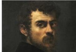
JACOPO ROBUSTI (TINTORETTO)