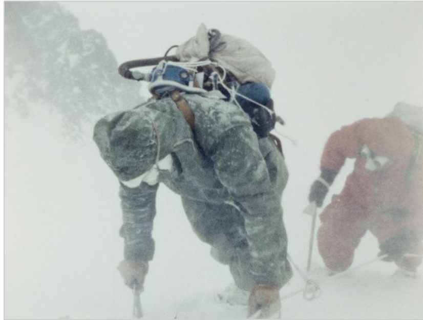
La spedizione italiana che conquistò il K2 nel 1954