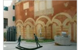
GALLERIA D'ARTE MODERNA PALAZZO FORTI VERONA