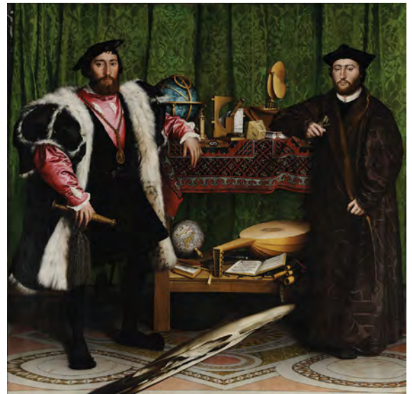
Figura 1 Hans Holbein il Giovane, "Gli Ambasciatori", 1533 (National Gallery, Londra). La figura ovoidale sul pavimento diventa riconoscibile solo se guardata dal lato destro del dipinto, a qualche metro di distanza: si tratta dell'anamorfosi di un teschio.

A partire dal Seicento vennero proposti altri tipi di anamorfosi, che potevano essere riconosciuti solo se visti riflessi in appositi specchi cilindrici, conici o piramidali. Molti furono i trattati che spiegavano la costruzione geometrica di queste figure, tra i quali ricordiamo la Perspective curieuse ou magie artificielle des effets merveilleux , (1638), del matematico francese Jean-François Nicéron (1613-1646).